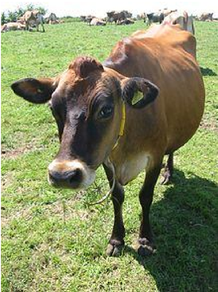
Vaches Jersiaises x Normandes