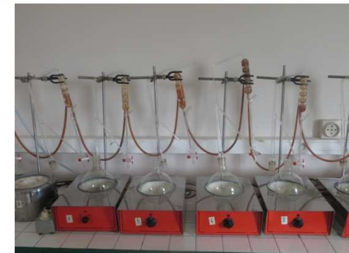
Conservatoire National des Plantes