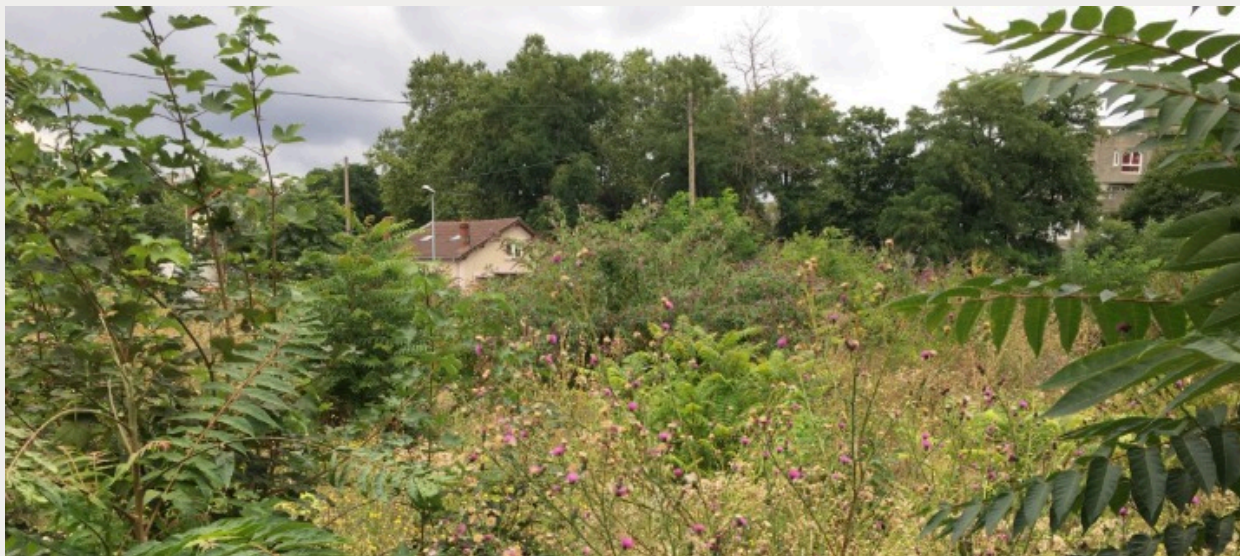
Friches à Aubervilliers