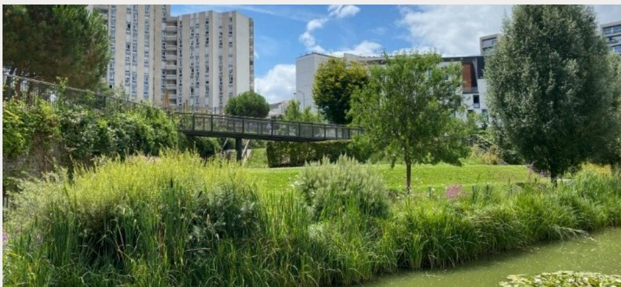
Ecoquartier construit sur l'ancienne gare de Rungis, Paris13ème