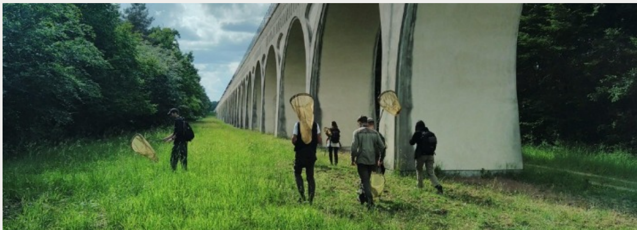
Session de terrain Rhopalocères - session de perfectionnement - ERE 2025