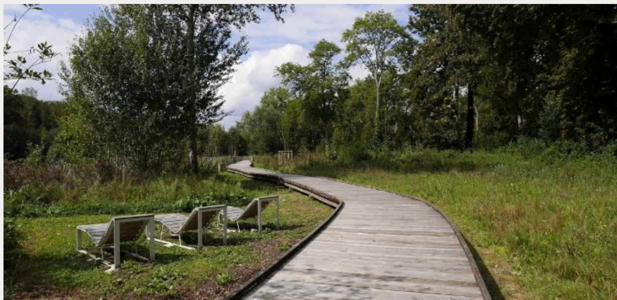
Parc du Colombier, Breuillet