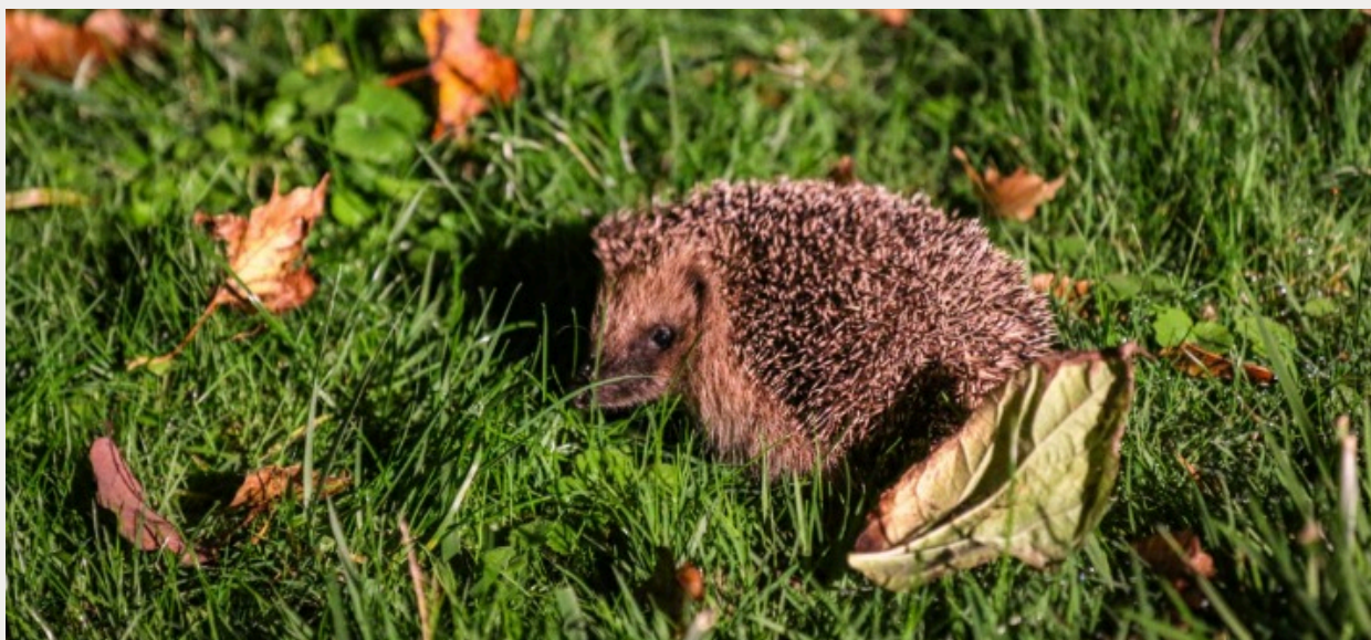
Hérisson d'Europe ( Erinaceus europaeus )

« Une saison, un taxon » Cycle de quatre webinaires