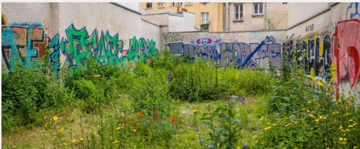
Visite Paris Nature Secret