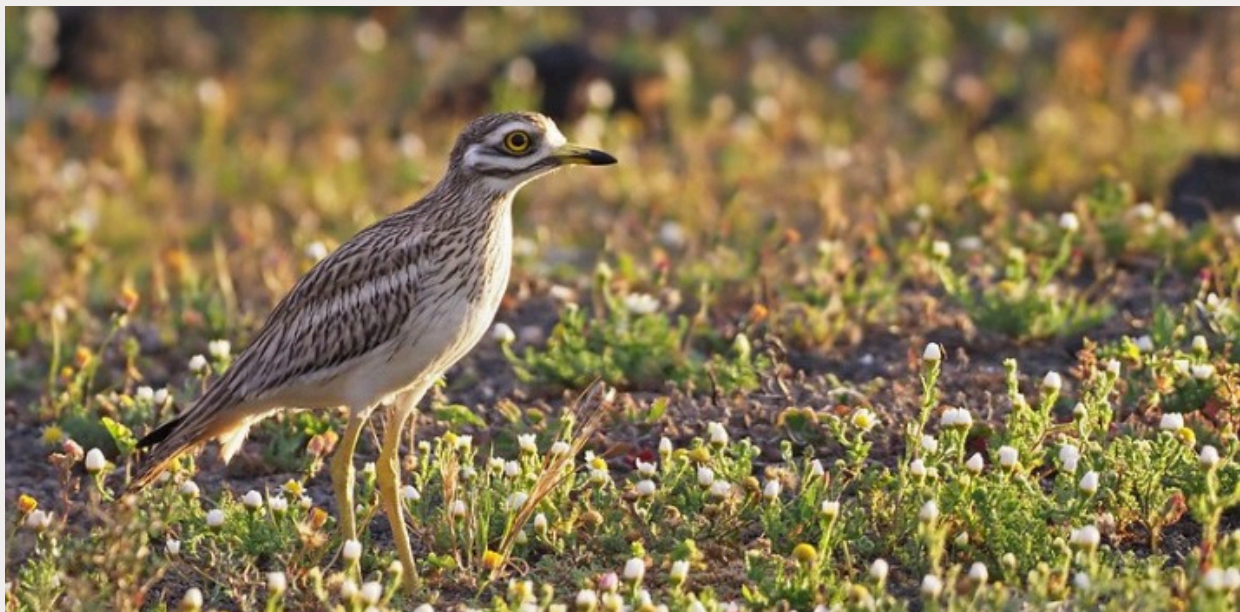
Œdicnème criard ( Burhinus oedicnemus )