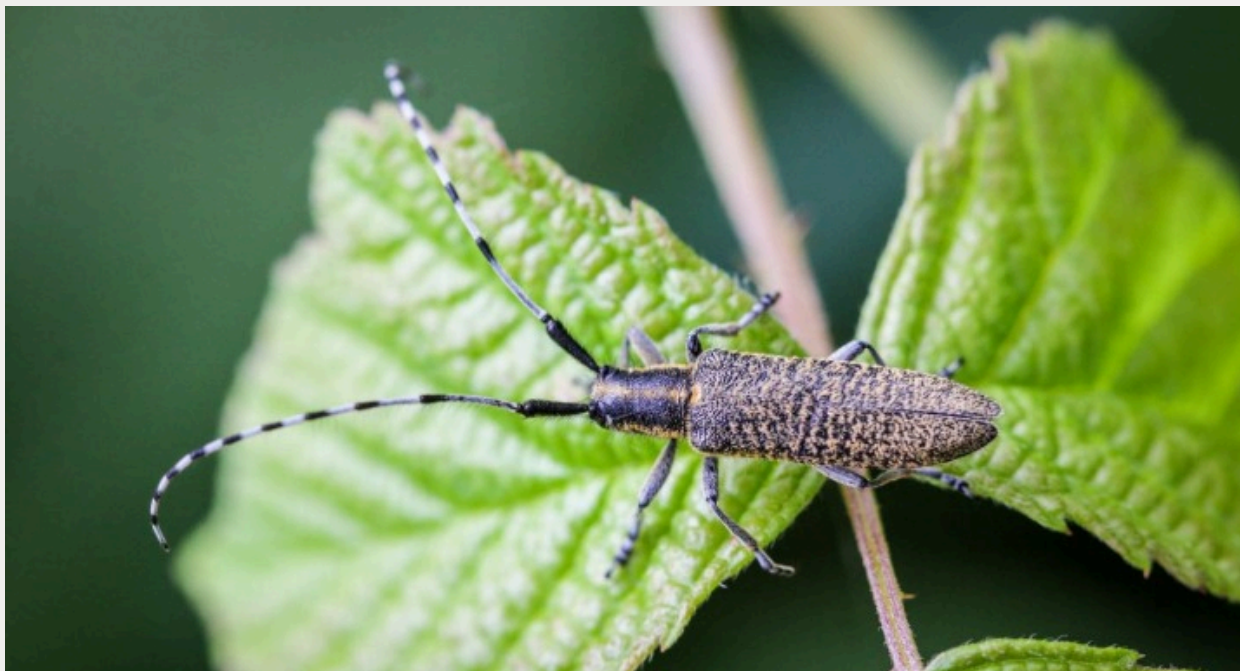
Aiguille marbrée ( Agapanthia villosaviridescens )