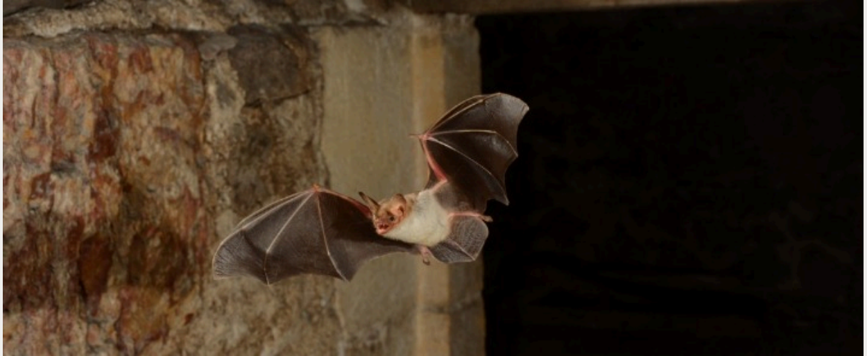
Grand Murin ( Myotis myotis )