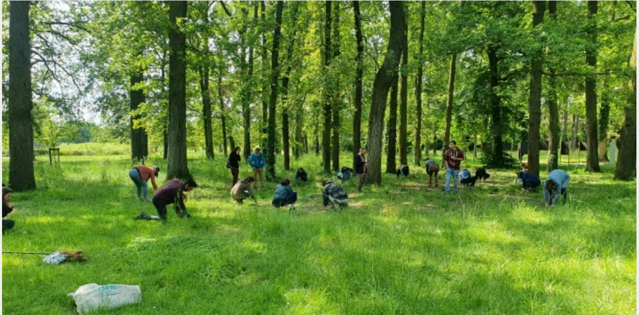
Initiation à l'animation de sorties Spipoll