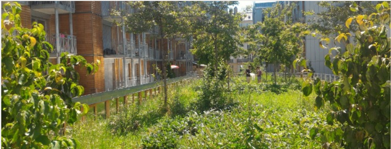
Toitures végétalisées