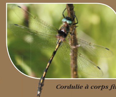
Cordulie à corps fin

Les zones humides, quant à elles, accueillent plusieurs espèces d'amphibiens dont l'incontournable Rainette verte qui offre, dès le mois d'avril, de véritables concerts.