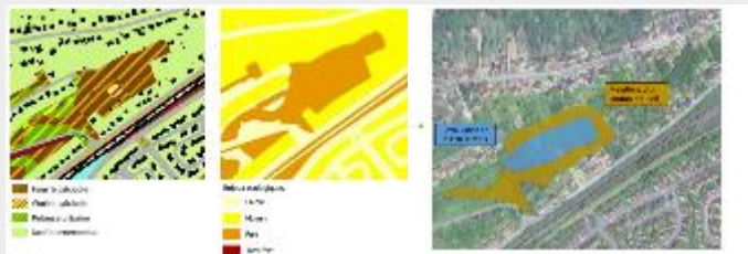
Action 2.1. Améliorer la valeur écologique de sites : Coteau calcicole, état des lieux et ciblage d'actions de restauration/valorisation