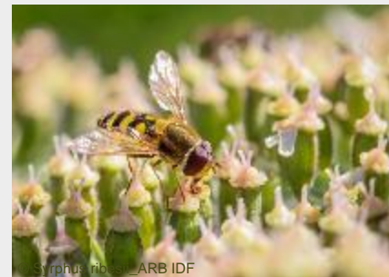
Syrphus ribesii - ARB IDF