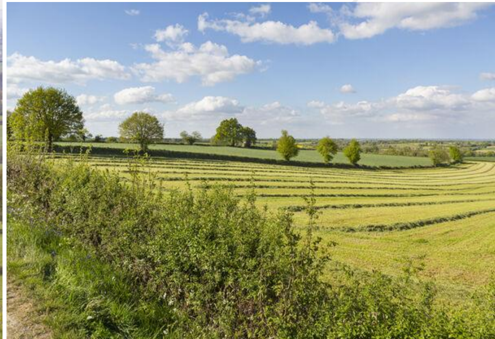
Bocage Vendéen