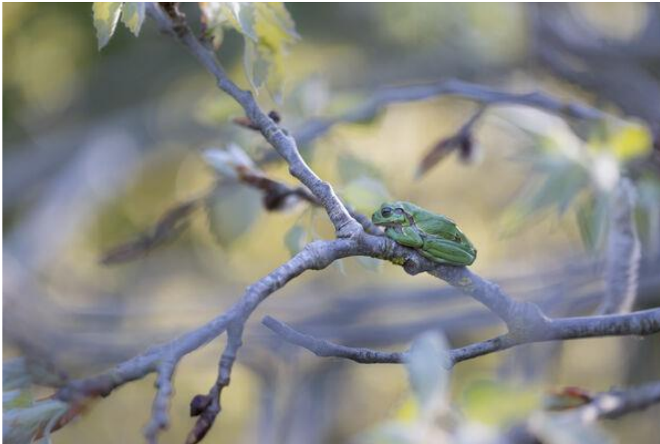
Rainette verte