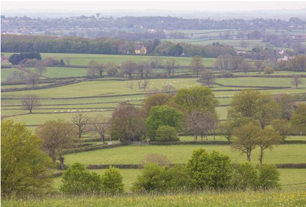
Bocage Bourguignon

2/ Trame verte caractéristique de certaines régions : entre 750 000 et 1,5 M de km selon les calculs