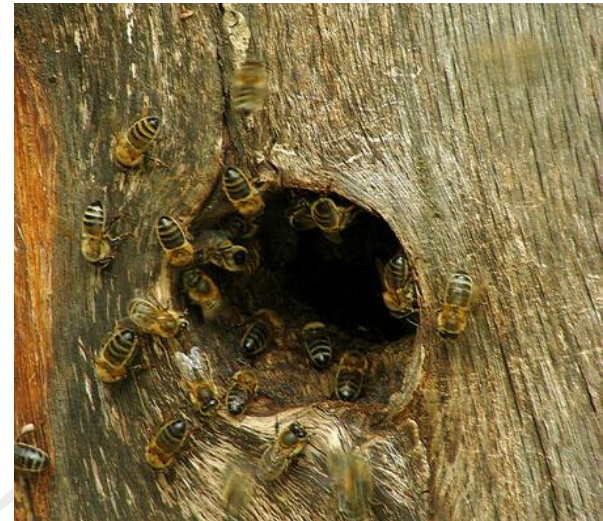
C. PINEL – OFB