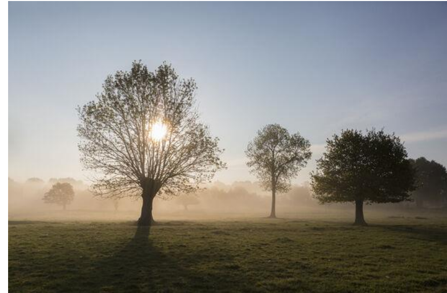
Bocage des Deux-Sèvres