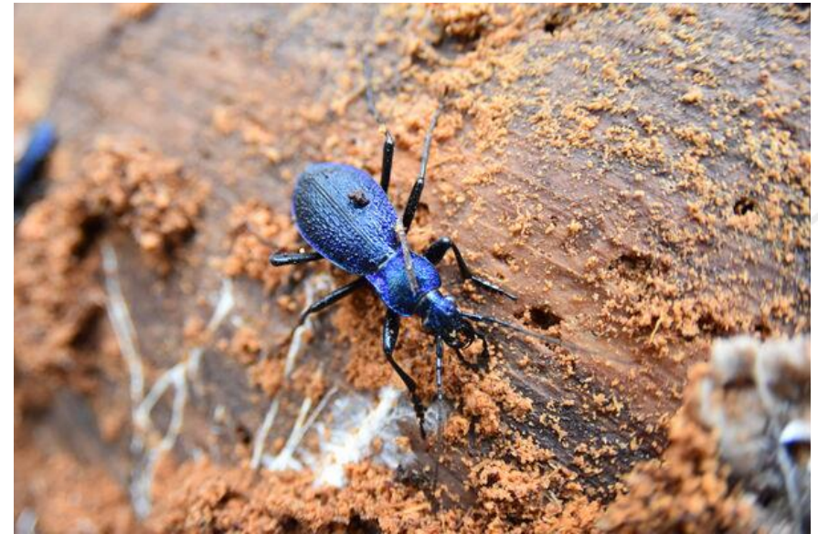
Carabe Embrouillé / B.GUICHARD – OFB