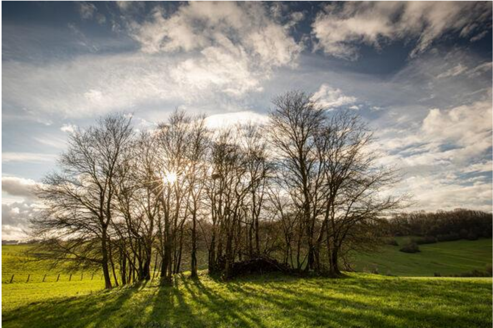
Sébastien LAMY - OFB