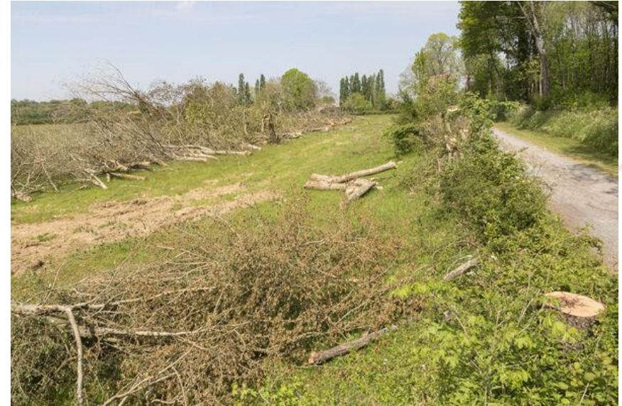
Exploitation de haie