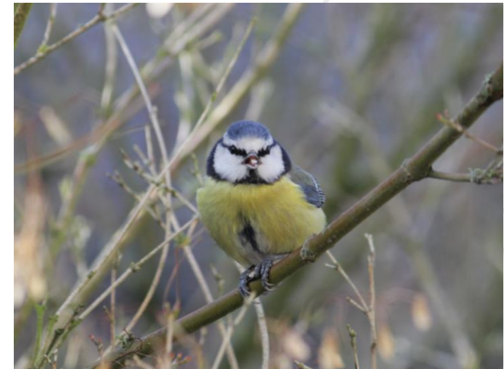
Mésange bleue