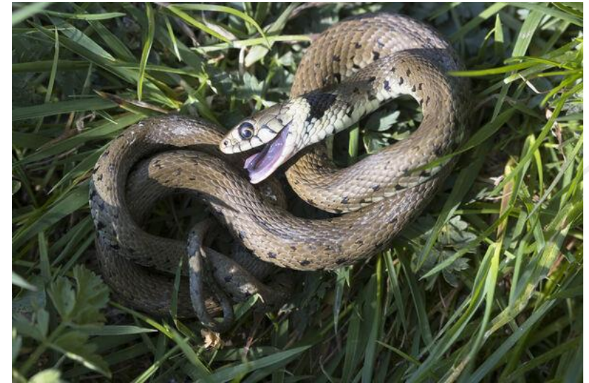
Couleuvre à collier