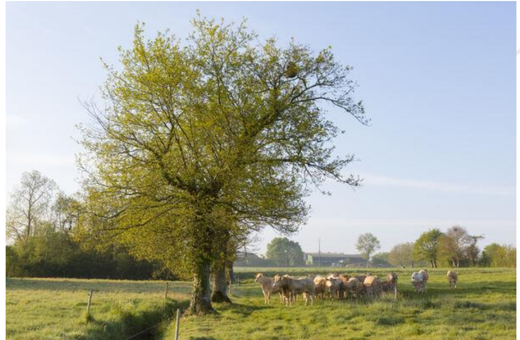
P.MASSIT – OFB