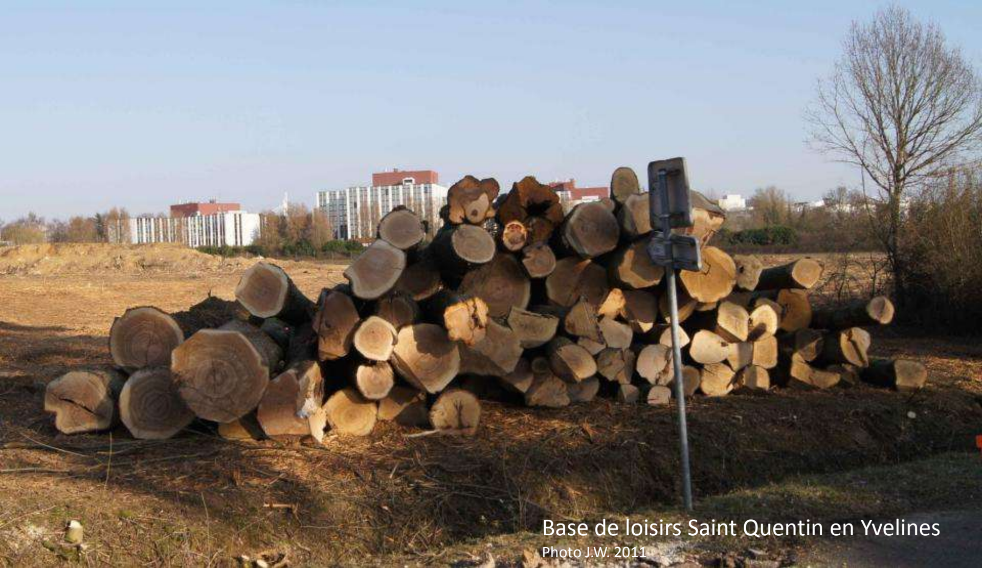
Base de loisirs Saint Quentin en Yvelines 2011

Ils étaient 62... Ils avaient traversé guerres et tempêtes et maladies... Quelques secondes de bêtise humaine en eurent raison.